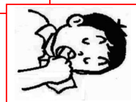
(顔を横に向けてかき出す)